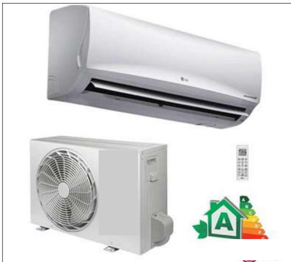
Figura 1. Climatizador Split high wall.